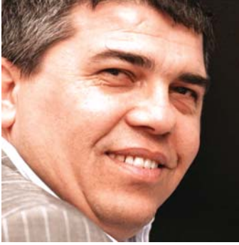
YAZI İŞLERİ MÜDÜRÜ EDITOR IN CHIEF mpehlivan@telekomdunyasi.com

H epimizin malumu ve sürekli konuştuğumuz her ortamda ülkemizi kurtarma sohbetleri ve sonuçta kadere kendimizi teslim etmeler... Çalışmadan, üretmeden 'kısmet deyip' teslim olmak... Genelde doğu toplumlarının kültürel değer yargısı...