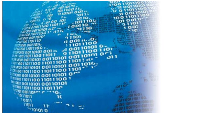
106 BİLİŞİM SUÇLARI Cafer CANBAY